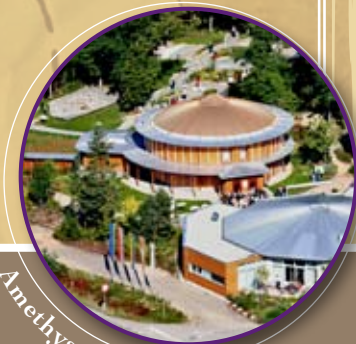
Amethyst Welt MAISSAU

Der Diesel-Oldtimerzug im Stile der 70er Jahre fährt auf der 40 km langen Lokalbahnstrecke zwischen der Weinstadt Retz und der Thayastadt Drosendorf. Genießen Sie das unverfälscht nostalgische Eisenbahnambiente in zweiachsigen Waggons mit offenen Plattformen, die Aussicht auf abwechslungsreiche Kulturlandschaften und die Schmankele der Winzer im „Heurigenwaggon“!